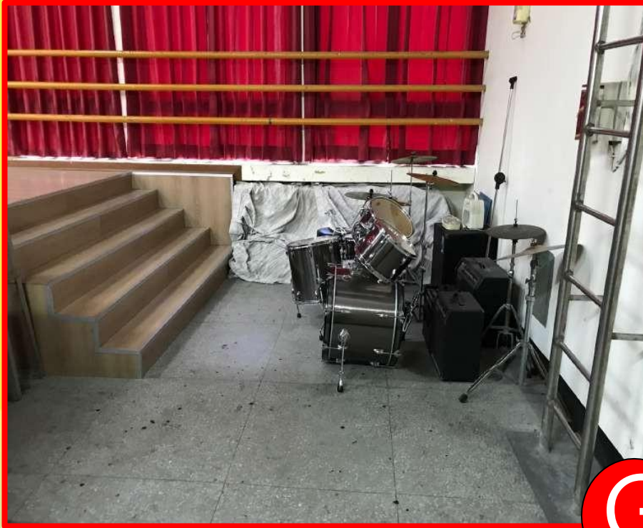
退場舞台下台階梯