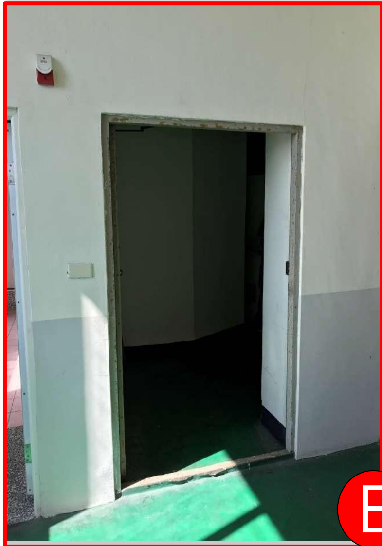
第一準備區通往第二準備區之入口 W100cm*H180cm