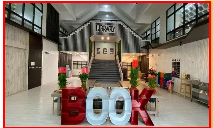
圖書館一樓報到區