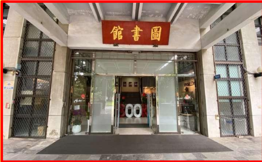
圖書館一樓報到區入口